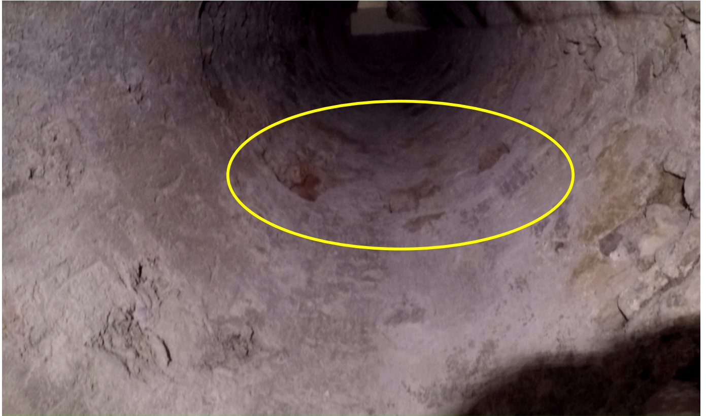
Trois trous de boulins côté sud-est, vers - 4,5 m (idem côté nord-ouest)