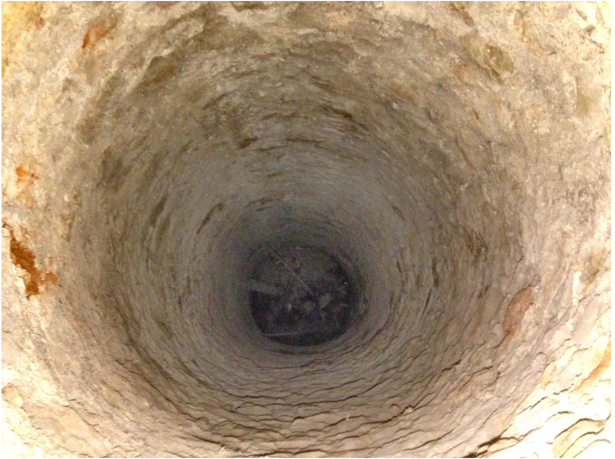
Vue sur le fond du puits