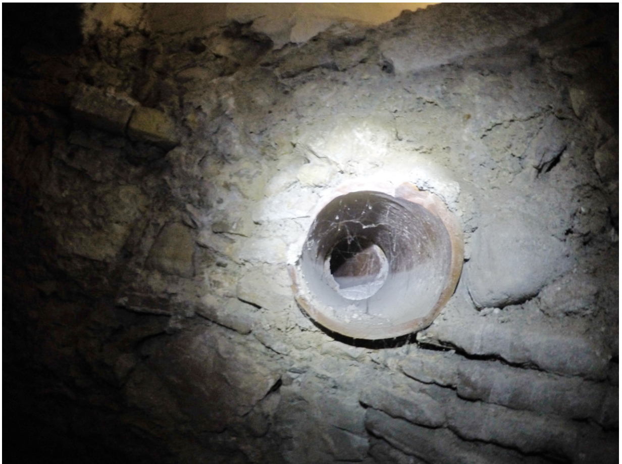
Canalisation en poterie vernissée se déversant en tête du puits