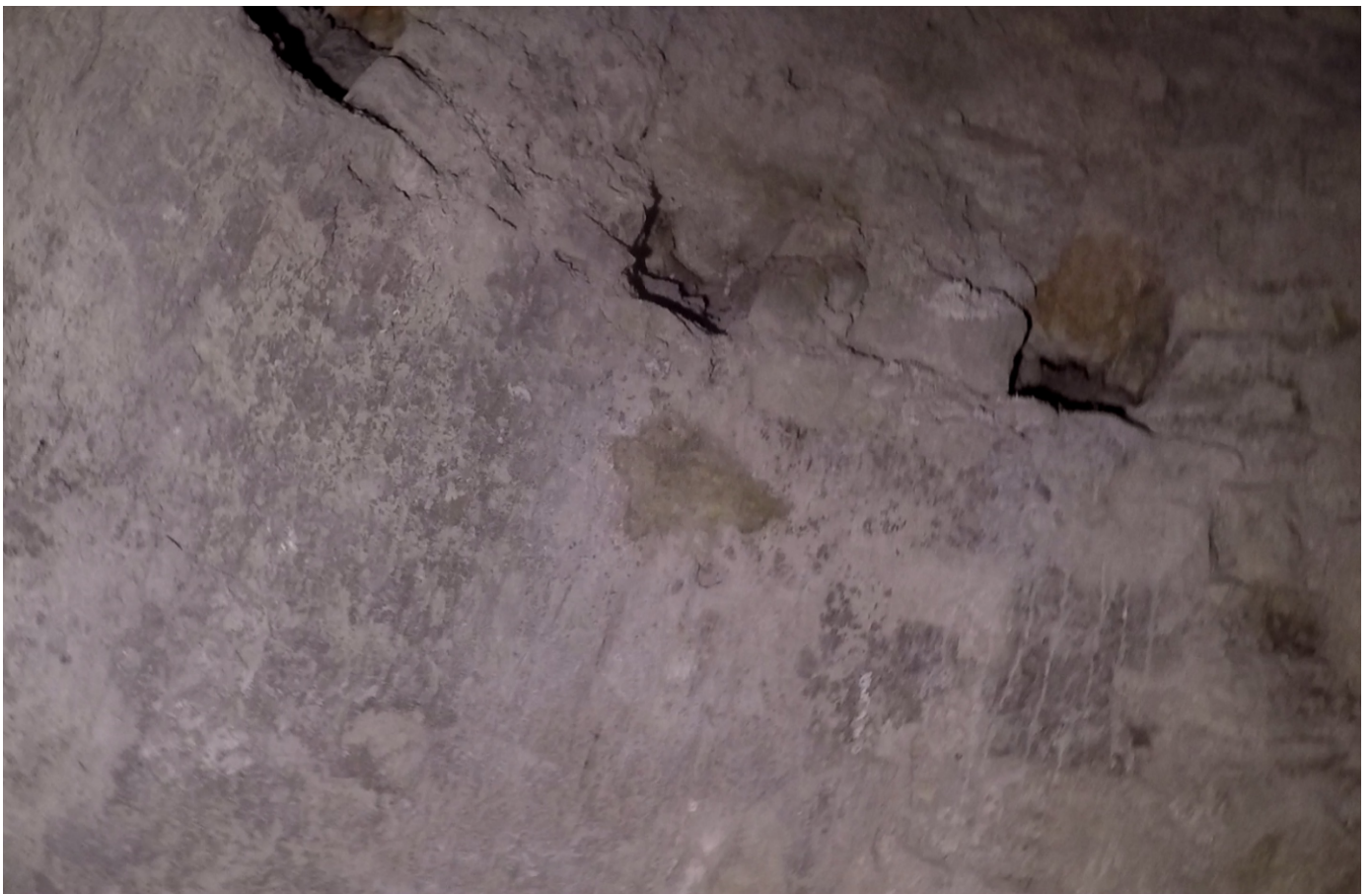
Vue rapprochée sur les trois trous de boulins côté sud-est