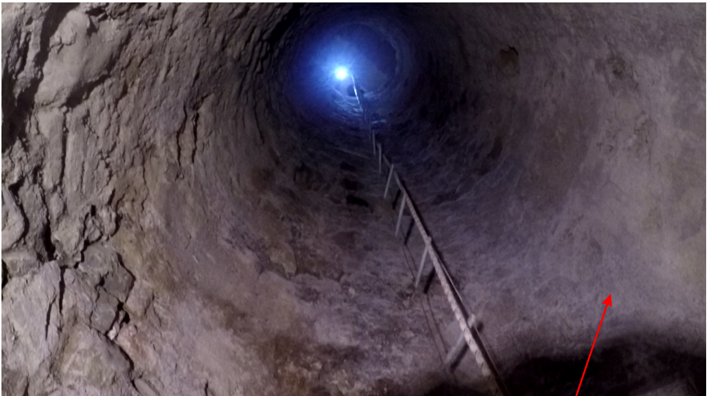
Vue vers le nord-ouest depuis le fond du puits