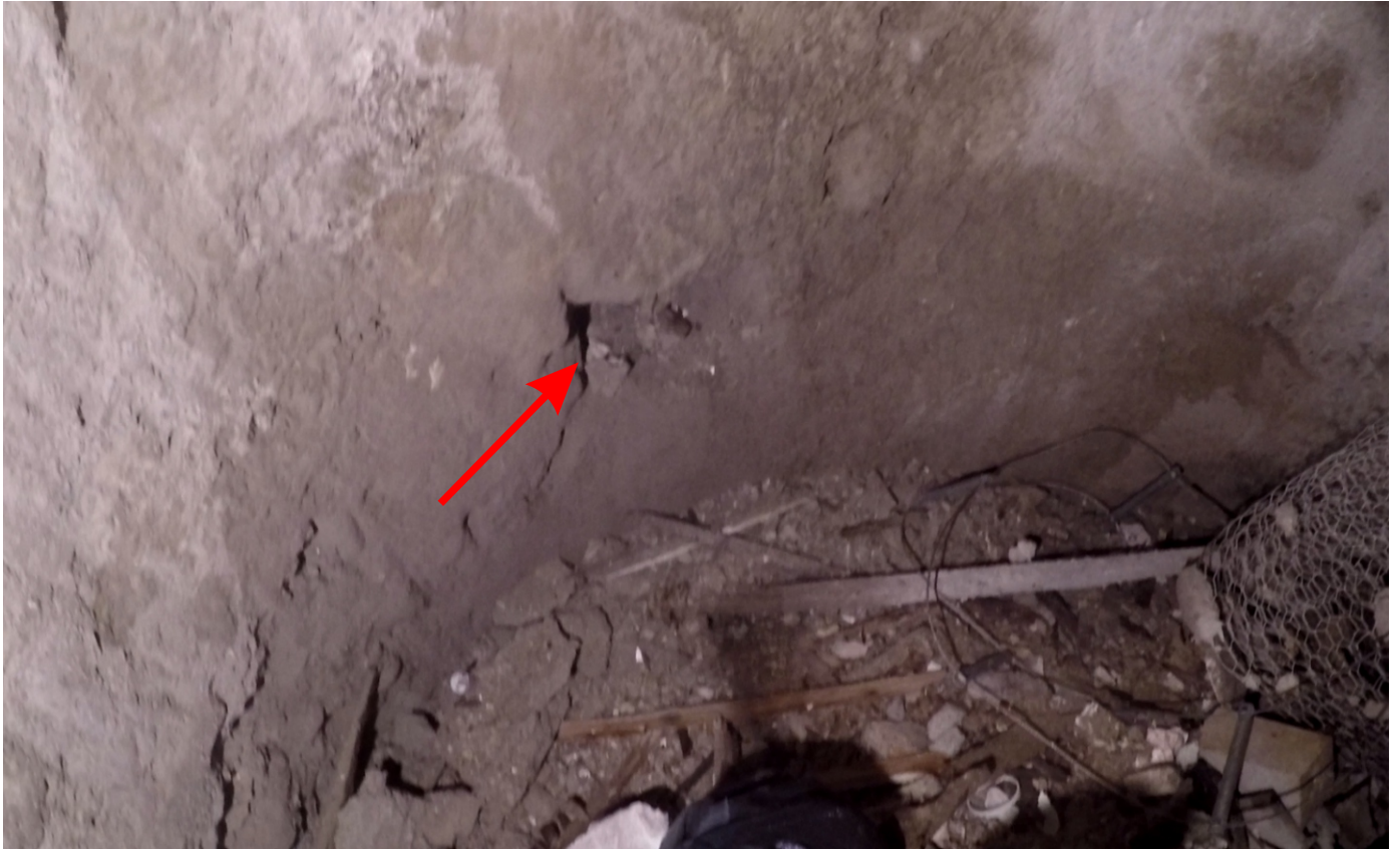
Une barbacane dans la paroi inférieure du puits