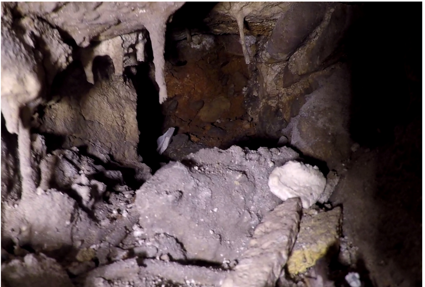
Vue à l'intérieur d'une barbacane

(on y observe des alluvions : galets pris dans une matrice rougeâtre)