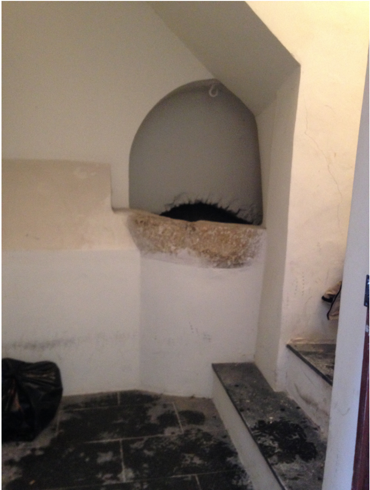
Tête du puits

Profondeur : le puits est encombré de matériaux à 8,25 m de profondeur Sa profondeur totale est probablement de l'ordre de 9/10 m.