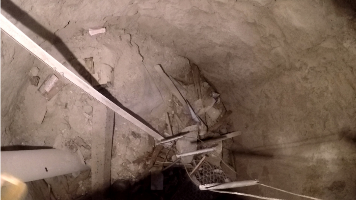
Matériaux encombrant le fond du puits